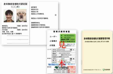
(左上) 身体障害者補助犬認定証 (右上) 身体障害者補助犬健康管理手帳 (左下) 盲導犬使用者証 (右下) 身体障害者補助犬健康管理手帳