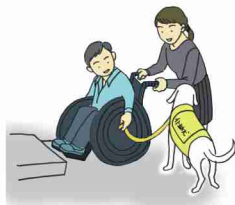
乗り越えられない段差の介助