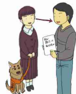
館内放送や電車内のアナウンスの伝達