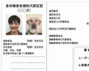
(左上) 身体障害者補助犬認定証