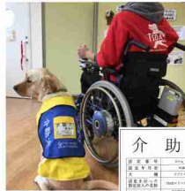
(左) 介助犬とユーザー (右) 介助犬の表示