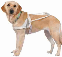
ハーネスを着けた盲導犬