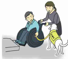
乗り越えられない段差の介助