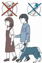
不慣れな場所への誘導

お困りの様子が見られたらユーザー本人に「何かお手伝いしましょうか」「どのようにお手伝いすればよろしいですか」などの声かけや筆談でコミュニケーションをとりましょう。