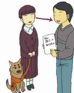
館内放送や電車内のアナウンスの伝達