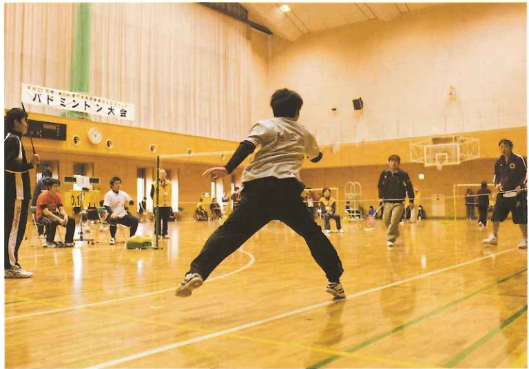
試合は障害者と健常者のミックスで行われた。1チーム3組ダブルスで対戦