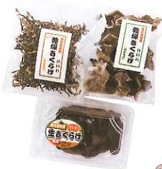
「鹿児島産キクラゲ」として、袋詰めやパックにして出荷販売