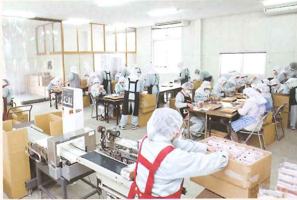
衛生管理された工場内で、かつおパックの袋詰め作業を行う訓練生たち