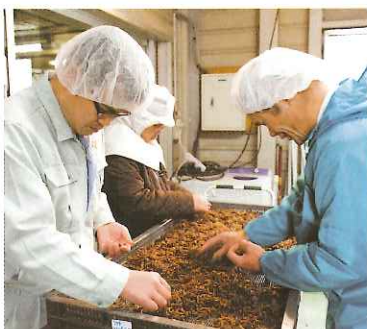
収穫したてのキクラゲをスライスして、選別作業を行う