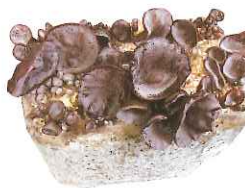
菌床ブロックから次々と芽を出すキクラゲ（鹿児島市坂之上の障害者自立支援センターハーマニー）

のプリプリ感も味わってほしいです」。出荷は県内7カ所のスーパーや道の駅イオン、Aコープなど。4月からはこれまで以上の採算を見込んでいる。「自社で作った玉（菌床）も地域に提供したいと思っています。私たちは福祉屋。利用者の方が楽しく働いて安定した生活を送ってくれたらそれです。この事業で少しでも高い工賃をあげられるようにしてさしあげたい。これが私たちのサービス。今後地域で働く障害のある方を支援していきたい」。そう話してくれた。