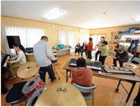
純粋に音楽を楽しみ、自由にカラフルなハーモニーを奏でる「キャンディビーツ」のメンバー