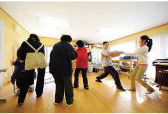
テンポのいい音楽に合わせて踊るメンバー。リズムの取り方やステップはさまざまだが、楽しそうな笑顔はみな同じ

ン。幼い頃からピアノやクラリネットに慣れ親しみ、大学の音楽科を卒業後は、アルトサクソフラス奏者として独立。「尾崎佳奈子カルテット」や「ナウズ・ジャズ・オーケストラ」の奏者・アレンジャーとして、ライブやジャズバーを舞台上に活動。ジャズピアノの山下洋輔さんと共演するなど音楽表現の幅は広がるばかりです。