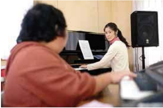
目と目を合わせて弾き始めのタイミングをはかる。音楽が生み出される前の静寂の時

「Candy Beats」というバンド名には、メンバーがあめ玉が大好きなことはもちろんですが、あめ玉に