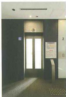
車いす対応エレベーター

手すりや背後確認用の鏡を設置したエレベーター。ドアの開閉時間が長く、安心して乗り降りができます。