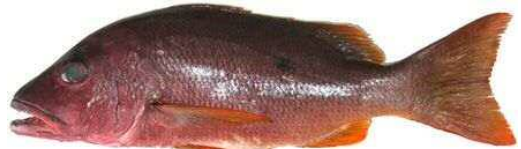
イッテンフェダイ