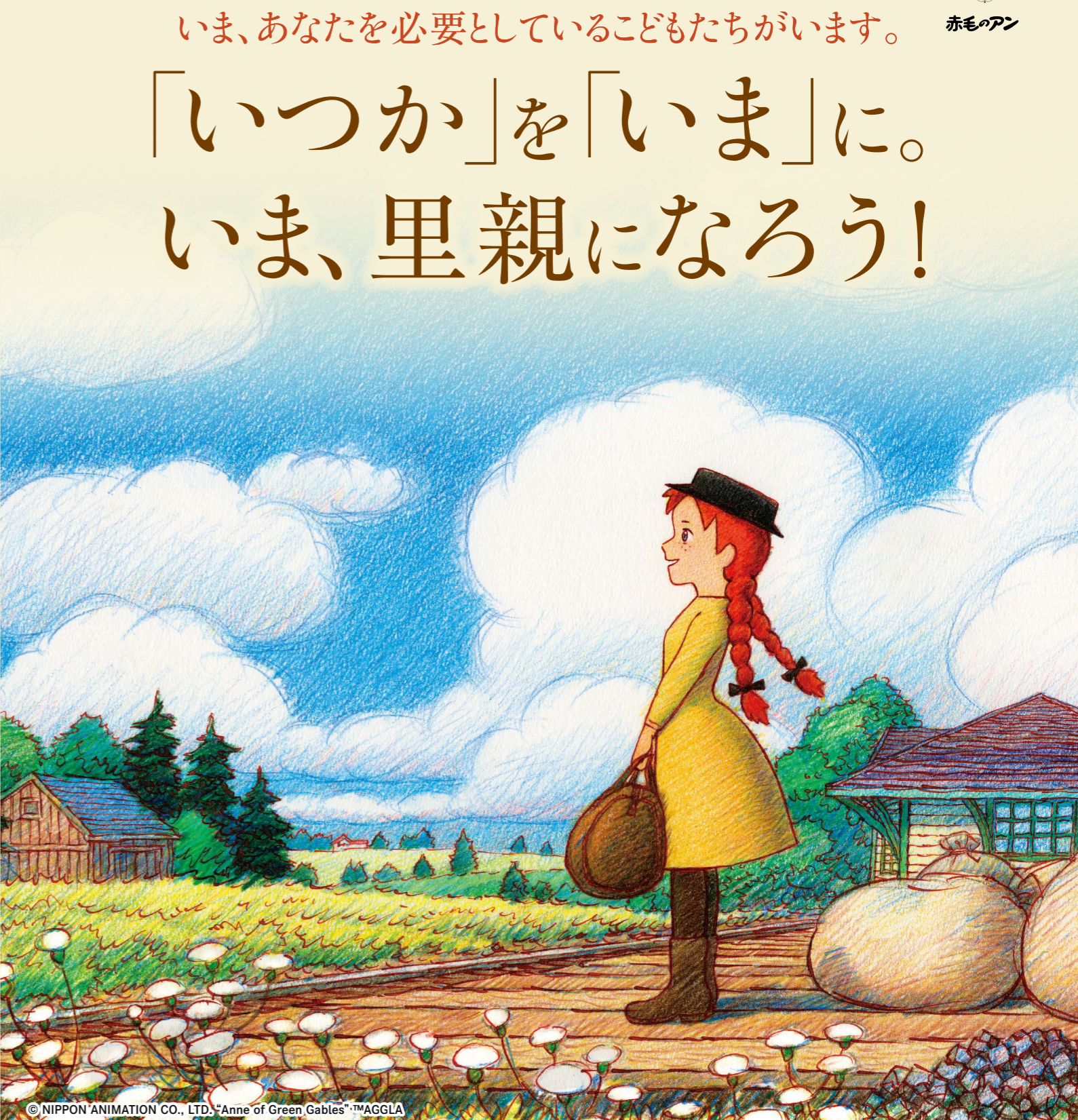
© NIPPON ANIMATION CO., LTD. "Anne of Green Gables"™AGGLA

あたたかな家庭を心から願ったアンは、マッシュウとマリラに出会い、二人の愛情に包まれながら、自分らしく豊かで幸せな人生を歩みます。 いま、日本には親と離れて暮らす子どもたちが、約4万2千人います。「里親制度」は、そうした子どもを自分の家庭に迎え入れ、必要な生活費や養育に関する相談など、さまざまなサポートを受けながら育てる制度です。 子どもの成長には、とによりで応援してくれる大人が必要です。子どもたちの力になれるのは、あなたです。