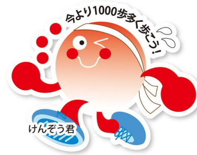
沖縄県 けんぞう君