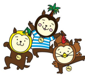
宮崎県シンボルキャラクター 「みやざき」