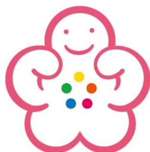
KENK●FUKU●KA ふくおか健康づくり県民運動