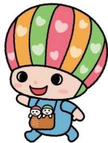
佐賀県子育て応援キャラクター さがびび