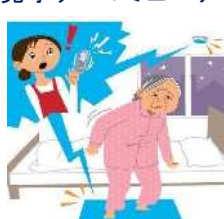
④見守り・コミュニケーション