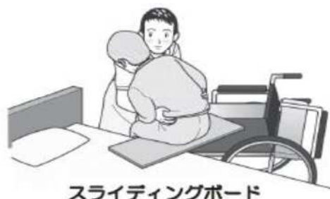
スライディングボード