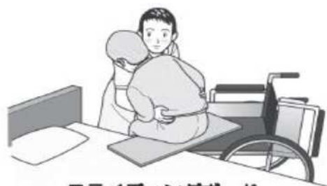
スライディングボード