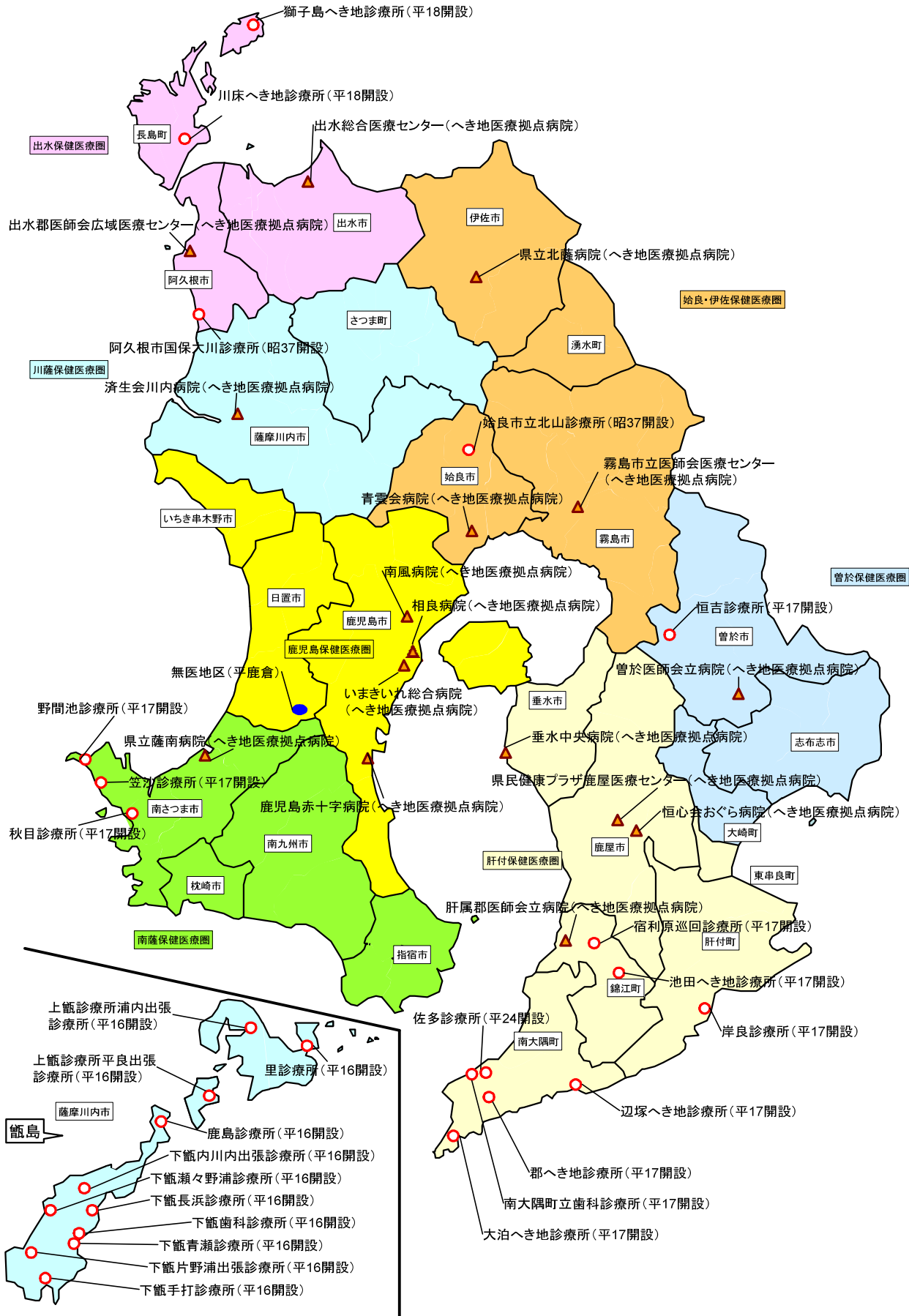
【図表5-4-23】 県内の無医地区，へき地医療関連機関の位置図（令和3年4月1日現在）