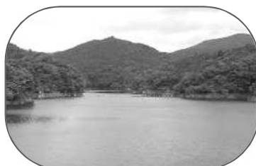
清らかな水を育む