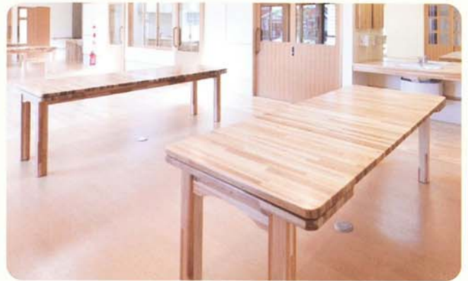
노인 홈의 테이블