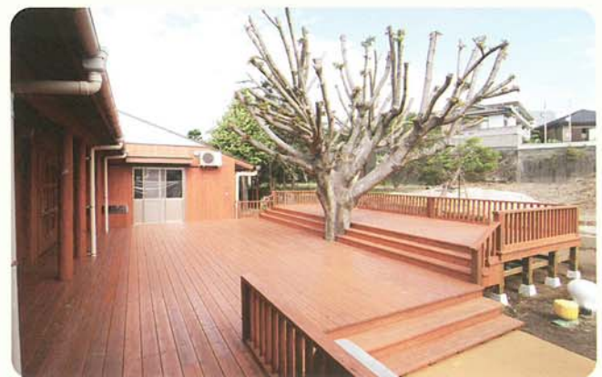
보육원의 우드 데크