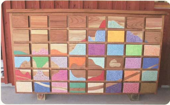
유치원의 소품 상자

테이블이나 의자, 선반 등과 같은 가구에 이용되고 있습니다. 목재의 부드러운 촉감과 따뜻한 느낌이 마음을 편안하게 해 줍니다. 한국에서는 특유의 향을 가진 편백나무 가구가 인기를 끌고 있습니다.