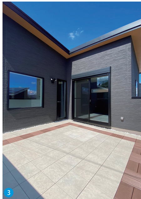
3 明るい日差しが降り注ぐルーバルコニーではBBQや子どものプール遊び等が楽しめ、生活の幅を広げてくれます