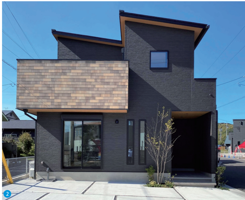
2 ダークカラーを基調に重厚感のある外観。特徴的な木目のアクセントでナチュラルテイストをプラス