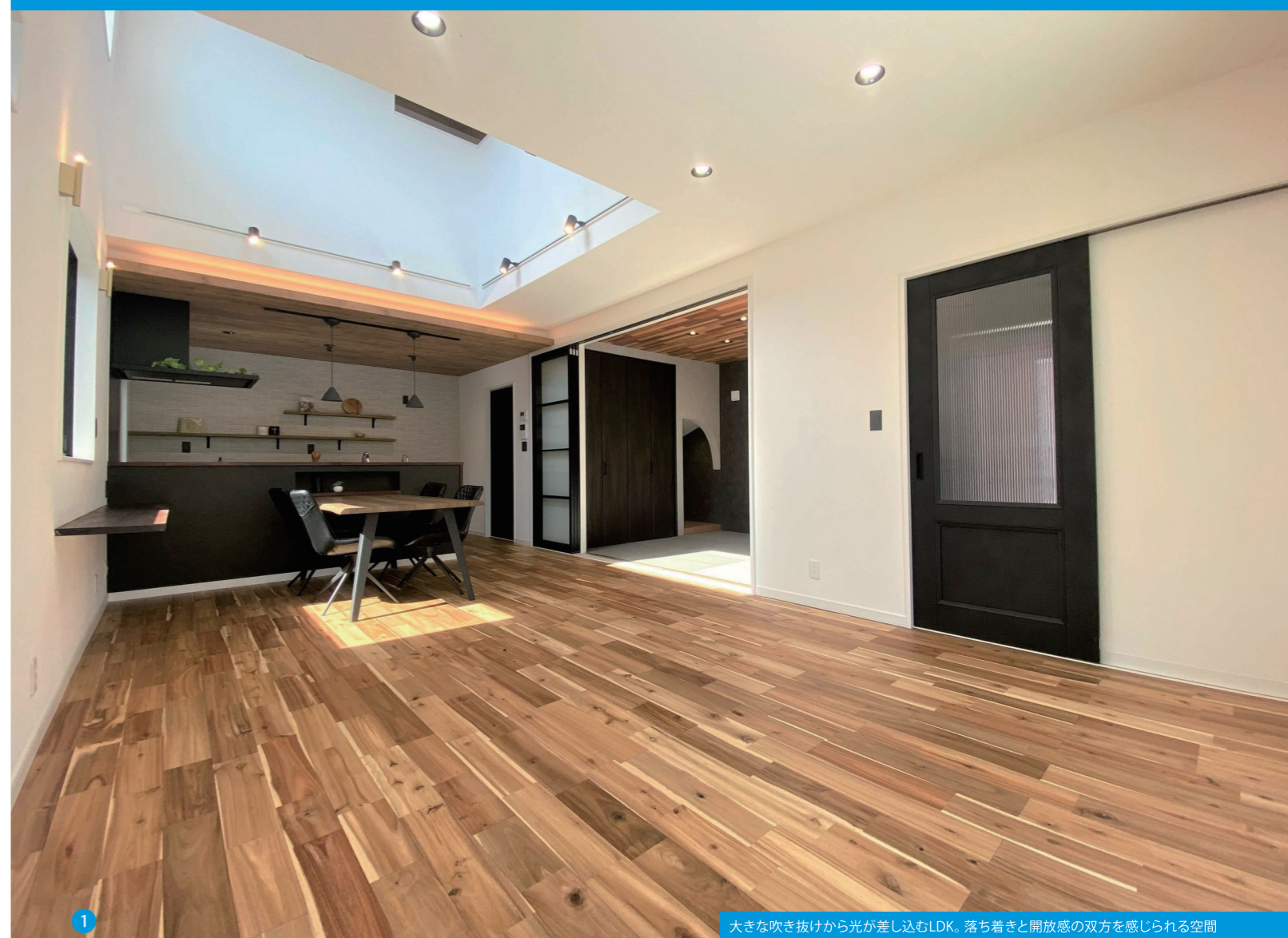
1 大きな吹き抜けから光が差し込むLDK。落ち着きと開放感の双方を感じられる空間