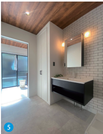
5 水廻りとサンルームをまとめた“洗う”、“干す”、“しまう”が楽にできる使いやすい家事動線。シンプルながら清潔感のある雰囲気