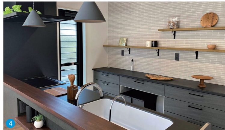
4 効率かつ機能性に優れたキッチン。モノトーンカラーに木目が映えるオシャレ空間になっています