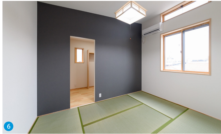
6 主寝室は畳敷きで一味違う雰囲気。3階ならではの眺望も楽しめます