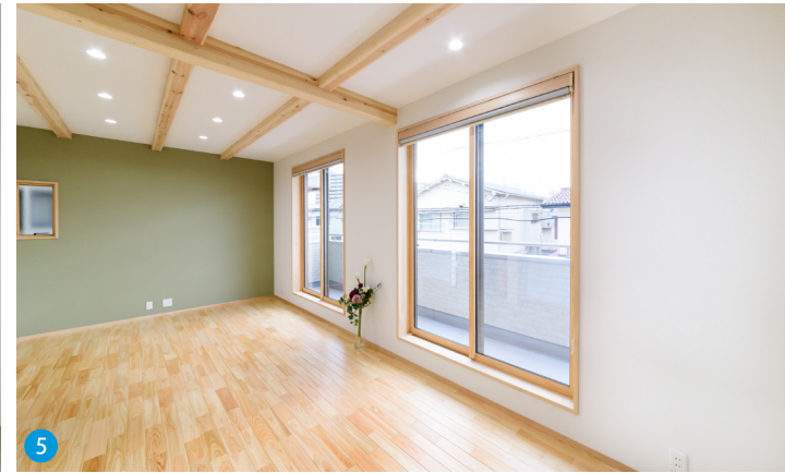
5 リビング側にはアクセントウォールを。構造現しが伸びやかさを演出します