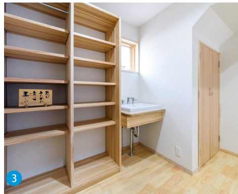
3 造作の収納や洗面台、建具および水廻りにも積極的に無垢材を用いています