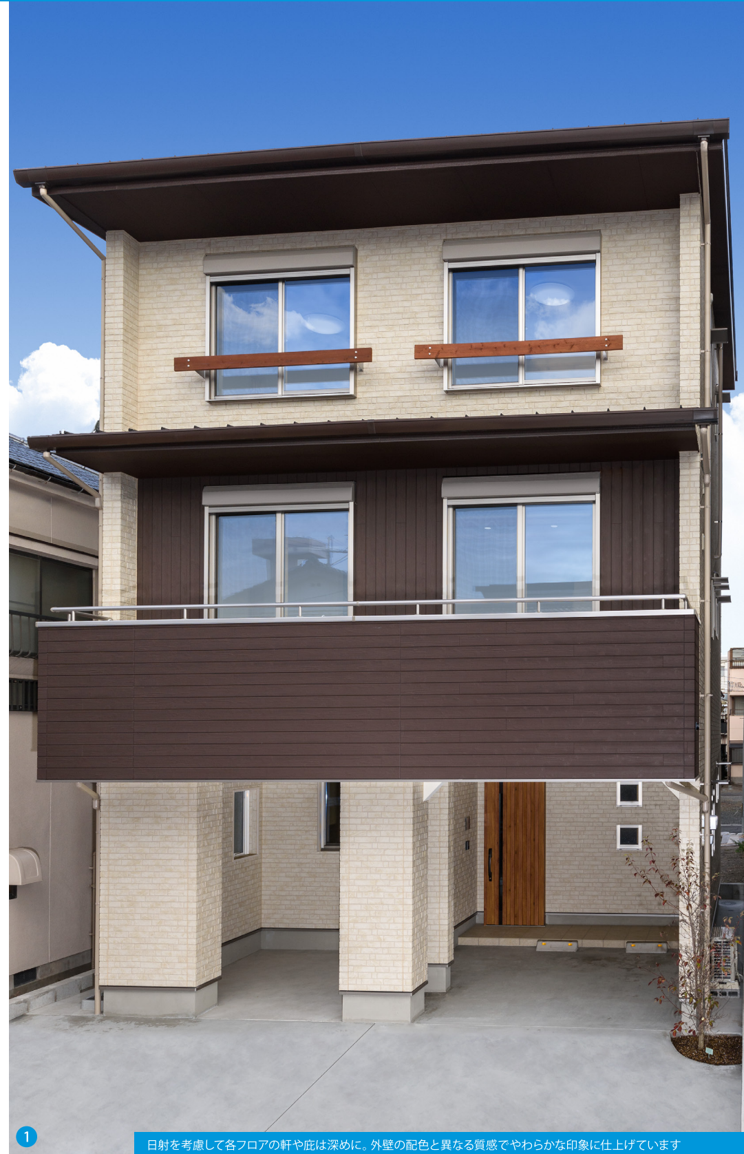
1 日射を考慮して各フロアの軒や庇は深めに。外壁の配色と異なる質感でやわらかな印象に仕上げられています

家族が集う2階のLDKは、大黒柱や床にはヒノキを用い、美しく上質な空間に仕上げられています。梁を見せた天井は、より広がりを感じさせる演出の一つ。無垢材の窓枠や造作収納が統一感を出し、住むほどに味わい深くなる経年変化の楽しみをもたらします。また、長く安心して暮らせる住宅性能にも注力。ZEH仕様に加え、耐震等級3、省令準耐火を装備しています。毎日の笑顔と安らぎを保障し「かごしま材」による温もり溢れる空間が完成しました。