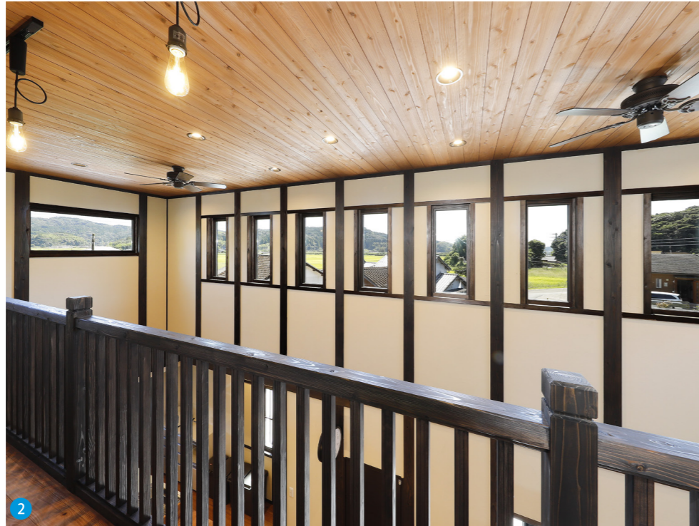
2 採光のために設けられた吹き抜け上部の窓から、自然豊かな四季折々の景色を見ることができます