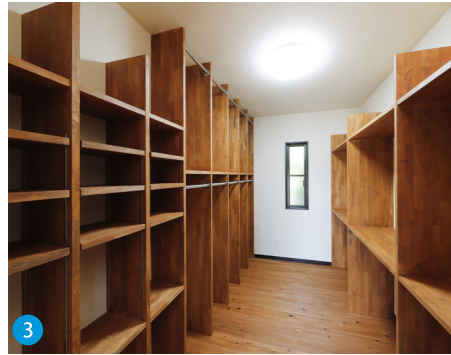
3 ランドセルや教材を2階の子ども部屋まで毎回持って上がらなくてもいいようにロッカーを併設したかごしま材使用のウォークインクローゼット