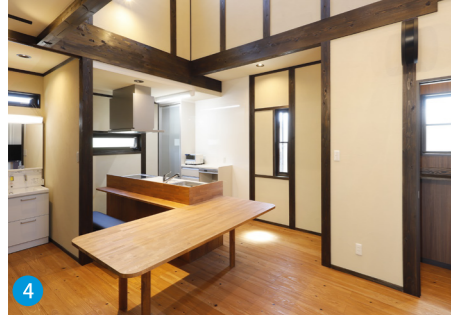
4 キッチンに併設されたダイニングテーブルにもかごしま材を使用し、配膳・後片付けの便利さはもちろん、子どもたちの勉強の見守りなどにも大きな役割を果たしています