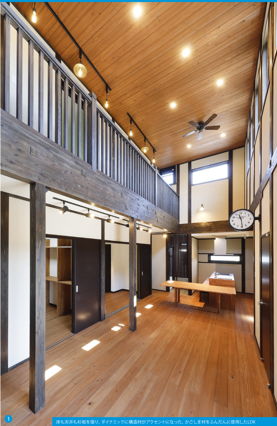
1 床も天井も杉板を張り、ダイナミックに構造材がアクセントになった、かごしま材をふんだんに使用したLDK

よく収納できるように造作ロッカーを併設。毎回、重たいランドセルを2階の子ども部屋まで持って上がる必要はありません。さらに、家事をしながら子どもたちとのコミュニケーションを大切にしたいお施主様のご要望で、キッチンにダイニングテーブル・カウンターテーブルを配置。子どもたちとの会話はもちろん、勉強の見守り、配膳や食器の片付けもラクに出来るようになっていきます。