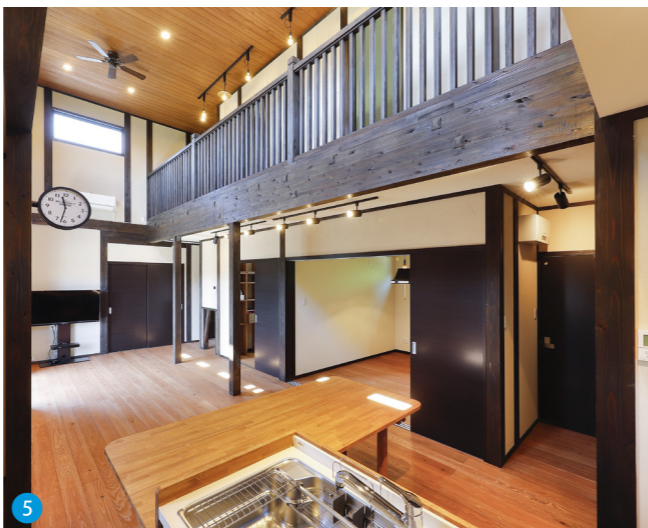
5 キッチンから見ると、LDKや2階の子ども部屋などほぼ全てを確認することができ、家事をしながら子どもたちの行動を見守ることができます