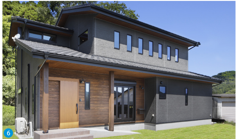
6 ご夫婦ともに黒がお好きということもあって、黒を基調にした外観に杉板の軒天をアクセントにしました