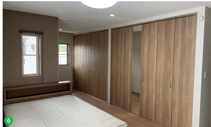
6 夫婦の寝室壁一面に広がるクローゼットと、奥にはコンパクトな書斎スペースを設置しました