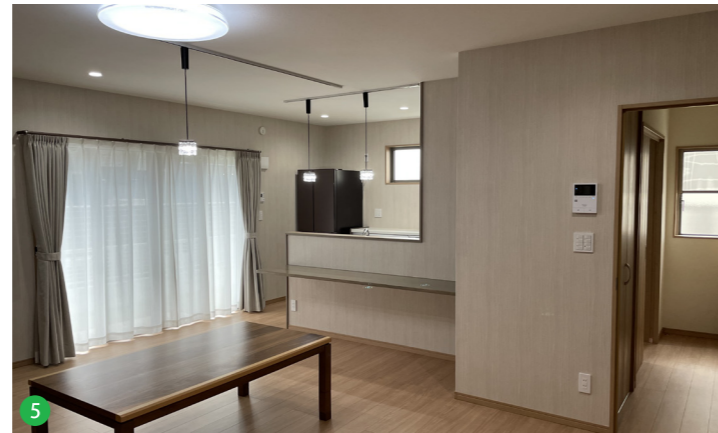
5 家事が楽になる回遊動線に設置されたキッチン。キッチン正面に設置されたカウンターと、それを照らすおしゃれなペンダントライトが周囲を美しく演出します