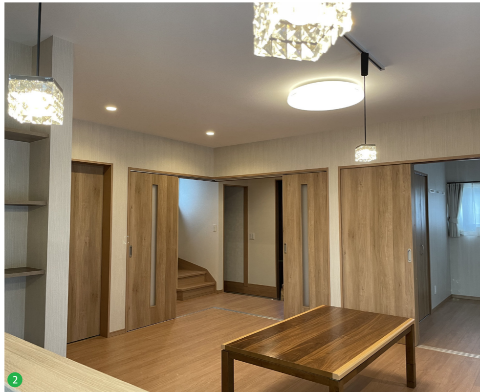
2 リビングを中心とし、家族間のコミュニケーションを深めるためのリビング玄関、リビング階段風な間取りが特徴です