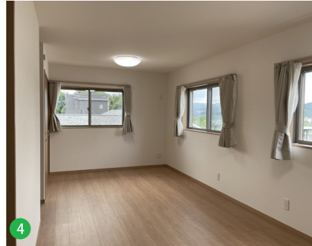
4 窓からの眺めが良い子ども部屋。成長に合わせて部屋を二分割することも可能です