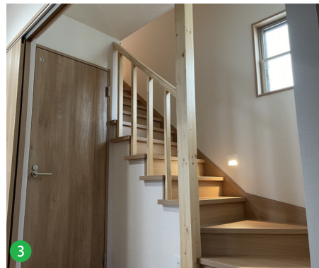
3 玄関横にはリビング階段を意識した階段。照明器具は目に優しいフットライトで、眠気を覚ますことなく二階の寝室へ