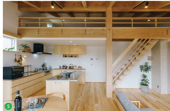
5 限られた敷地の中で無駄な動線がない設計により、居住空間をより広々と使えます