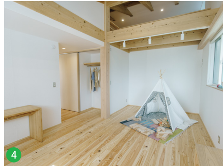
4 スケルトン・インフィル工法で、子どもが小さい時には広々と、大きくなったら個室に変更することができ、ライフスタイルに合わせて変更可能な間取り