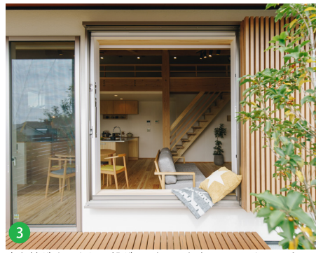
3 中と外がゆるやかに繋がる、とっておきのリラックススペース