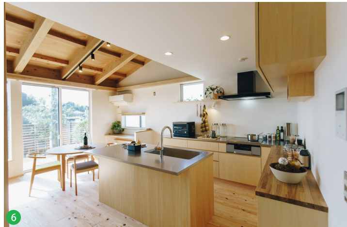
6 ダイニングと隣合うキッチン、料理を出したり食器を片づけたりするのに便利。料理中でも家族とコミュニケーションがとりやすい仕様