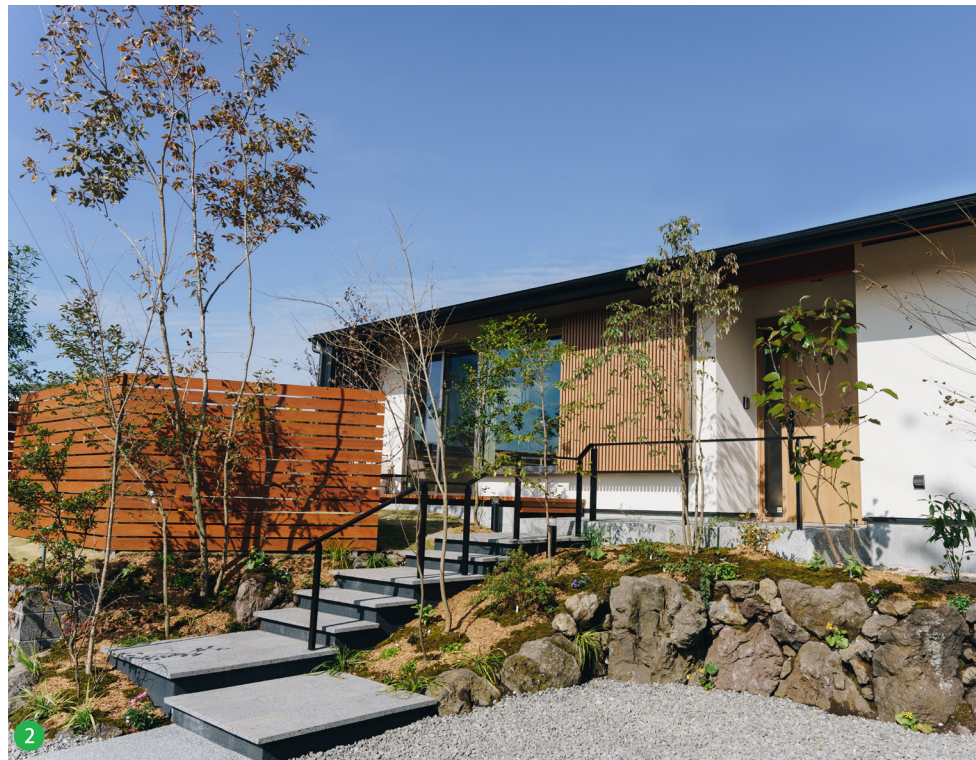
2 溶岩などの天然素材と木々が緑のトンネルとなり、季節ごとに楽しませてくれます