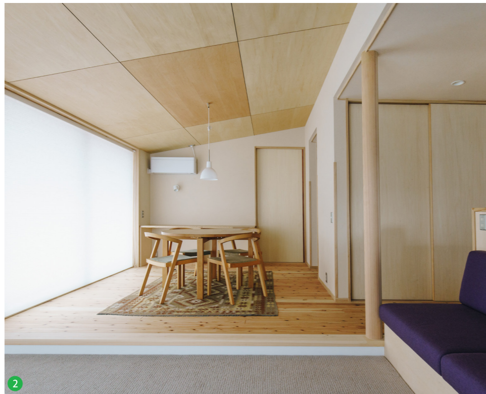
2 勾配天井のリビングとダイニングは平屋ながらも伸びやかでゆったりとした空間となった。スクリーンをしていても優しい空間となっています