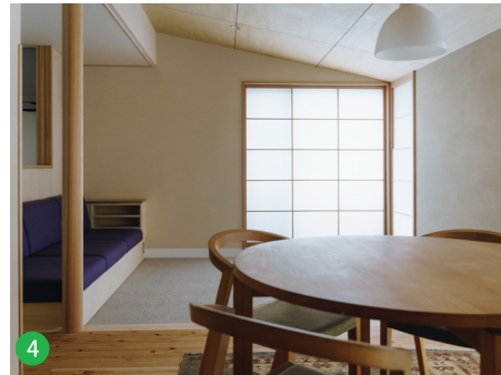
4 無垢の床材、珪藻土、カーペット、障子、化粧柱、ソファ全てが融合し美しくデザインされています。もちろんカーペットもウール100%の自然素材