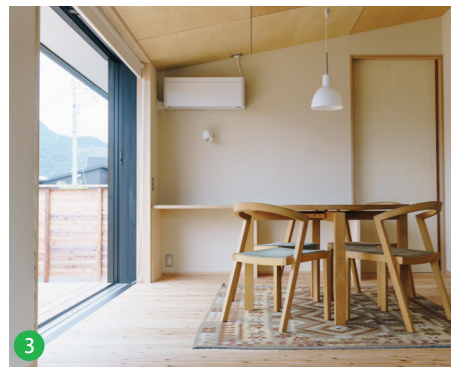
3 ダイニングの大きな窓を全開にするとデッキとつながる。テーブルの奥にはちょっとしたカウンターデスクを設け、その奥は子ども部屋に繋がっています