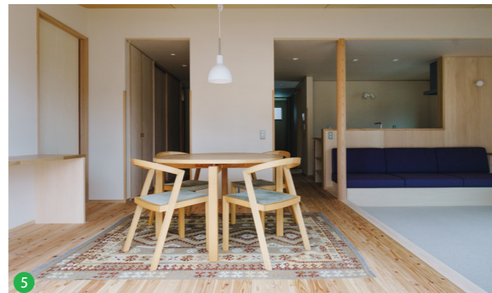
5 L字に配置されたLDK。キッチンからはLD両方、また庭先まで目が届くように配置。回遊動線により家事もしやすく暮らしやすい間取り