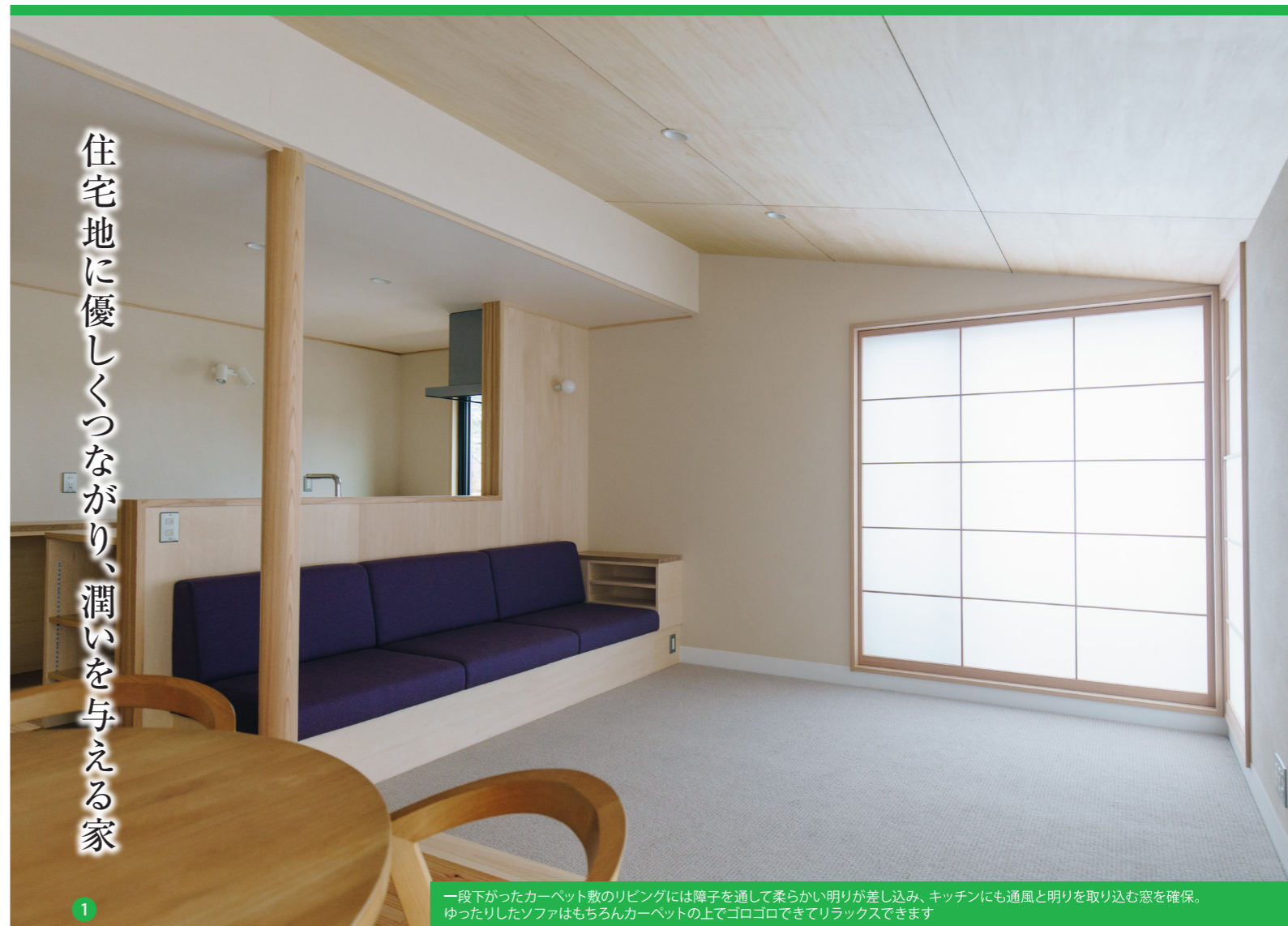
1 一段下がったカーペット敷のリビングには障子を通して柔らかな明りが差し込み、キッチンにも通風と明りを取り込む窓を確保。ゆったりしたソファはもちろんカーペットの上でゴロゴロできてリラックスできます