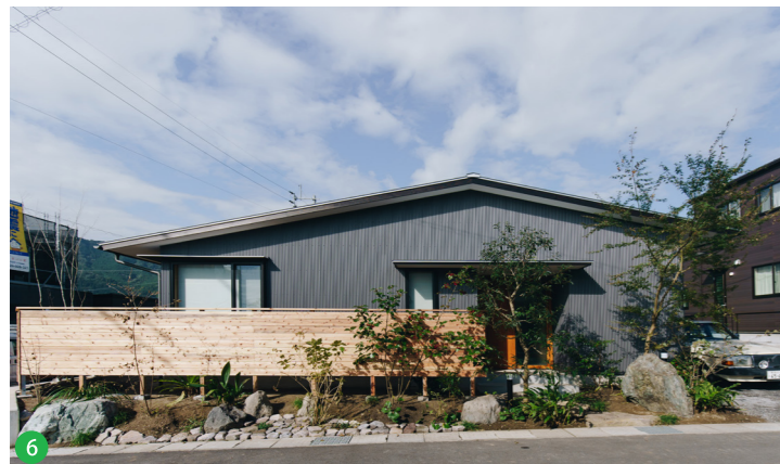
6 地元で集めた緑や岩、石を使用した外構。板塀と緑が住宅地と優しくつながると同時に、外部からの視線を上手く遮り、室内にはたくさんの明りを取り込んでいます