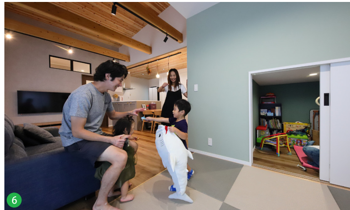
6 リビングからつながる四畳半の和室はキッチンからも目が届き、子ども用のおもちゃ収納も備えます