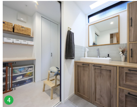
4 扉、取手、タイルなど一つ一つこだわったオリジナルの洗面化粧台。キッチンや脱衣室からの動線も◎