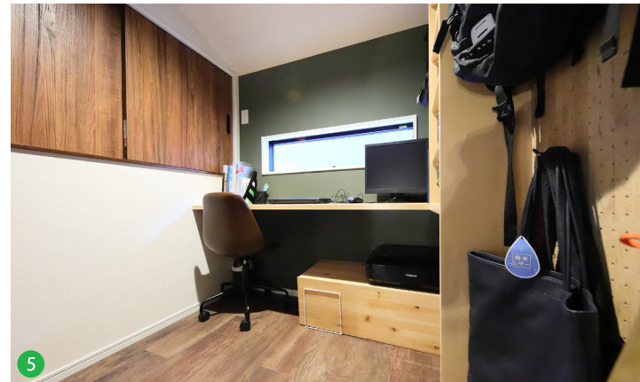
5 屋根裏を利用して、1.5階にご主人の書斎を設けました。棚や有孔化粧ボードなど自らチョイスしました