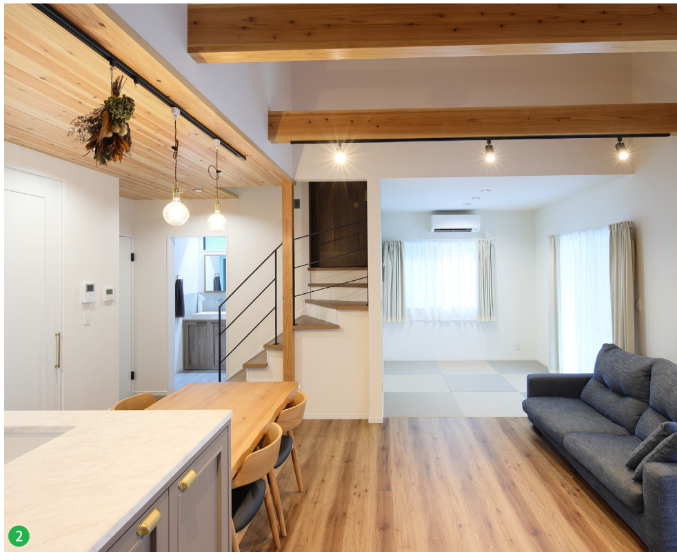
2 木の質感や、ホワイト&グレーの壁のバランスが美しい室内は、家事動線に配慮し、生活しやすいように考えられた利便性のいい間取りにしました