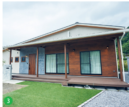
3 外壁やウッドデッキに木材を使用し、木の温もりに包まれるような優しい造りです