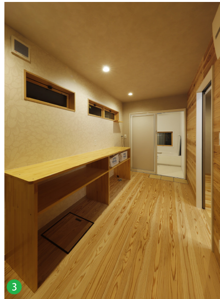
3 趣味スペースにもできる脱衣室。この内装も無塗装のかごしま材を使用しています