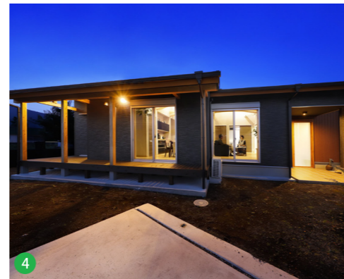
4 落ち着いた雰囲気の外観。屋根下のウッドデッキは脱衣室とダイニングキッチンをつなぎます