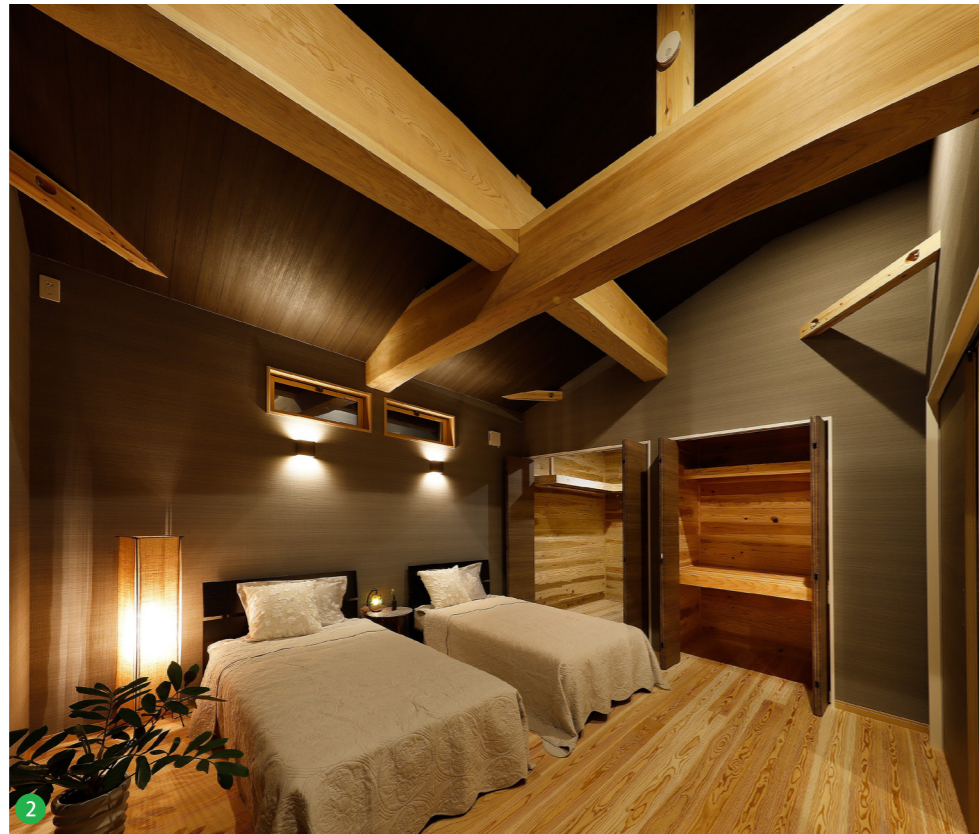
2 寝室は落ち着いた雰囲気の内装でまとめ、押入の壁と床材は無塗装のかごしま材を使用しています