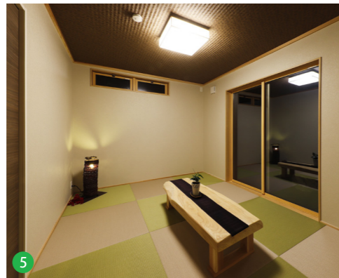
5 和紙表のフチなし畳を使用。曲がった梁と同じかごしま材を使用したオリジナルのテーブルも味わいがあります