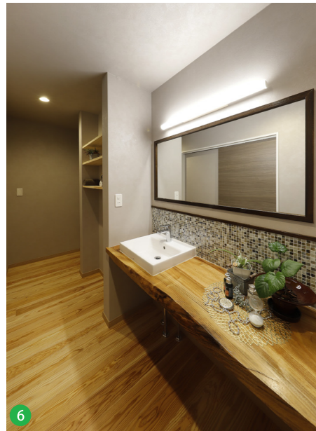
6 キッチン背部にある回廊性を持たせた洗面所。モザイクタイルがアクセントになっています