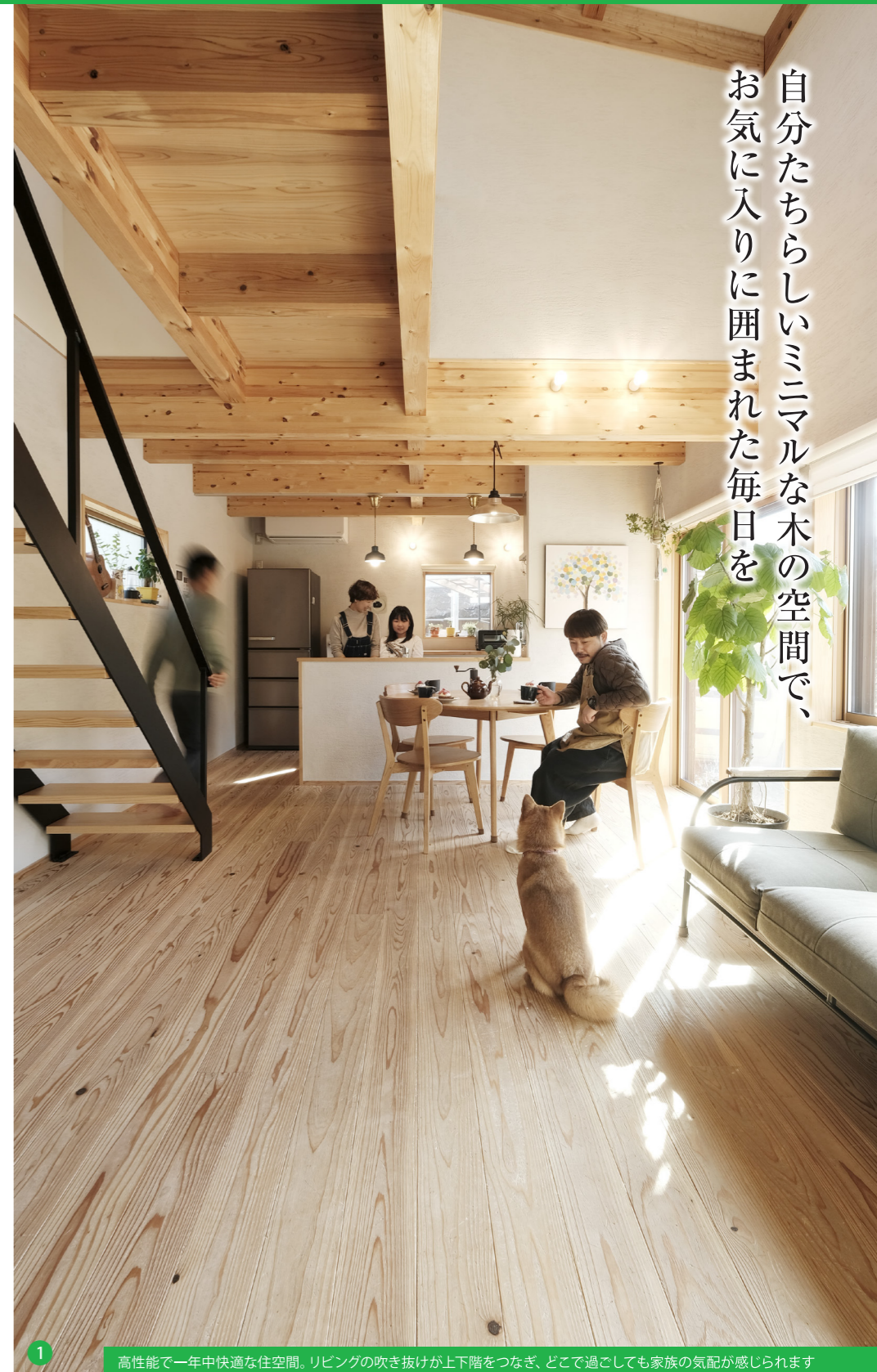
高性能で一年中快適な住空間。リビングの吹き抜けが上下階をつなぎ、どこで過ごしても家族の気配が感じられます