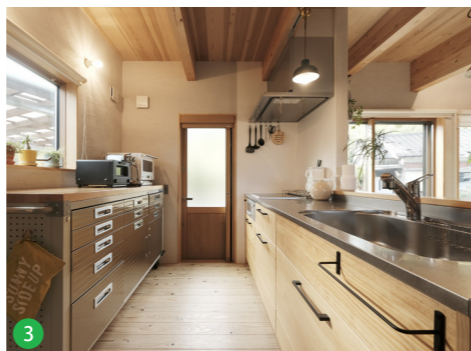
スーパーラジエントヒーターを採用したキッチン。遠赤外線調理で、おいしく、省エネ。キッチンにも無垢材を使用し、経年美が楽しめます