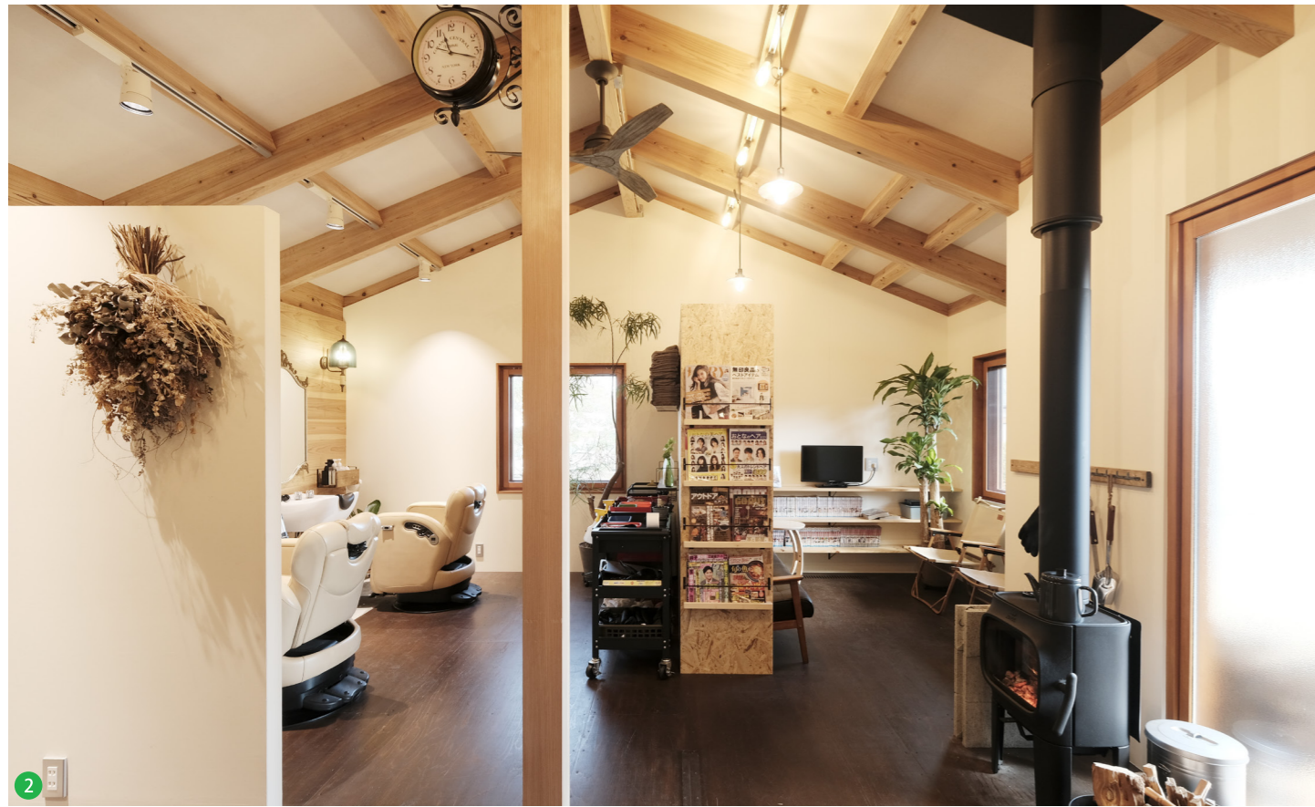
鏡や照明は旧店舗のものを再利用した。木の香りやシラス壁の質感、自然素材に包まれた空間は、お客様にも「落ち着く」と好評です