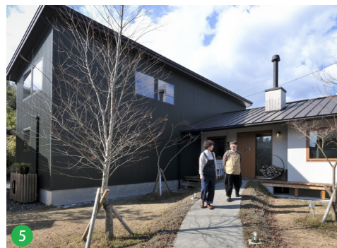
薪ストーブの煙突や鍍張りの板壁、木製サッシ、シラスの塗り壁など、思わず見つめたくなるデザインが魅力的な店舗に仕上がっています