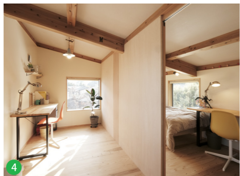
2階の高さは控えめに。屋根なりの勾配天井で、小屋裏のような落ち着いた空間に。間仕切りは簡易なものとし、可変性をもたせています