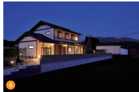
6 致寄屋風の外観。夜は屋久島地杉を使った格子から漏れる明かりが温かくも凛とした雰囲気演出します