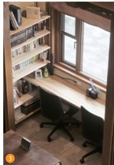
3 キッチン近くに設けたスタディスペース。家事をしながら子供達の勉強を見守ることができます