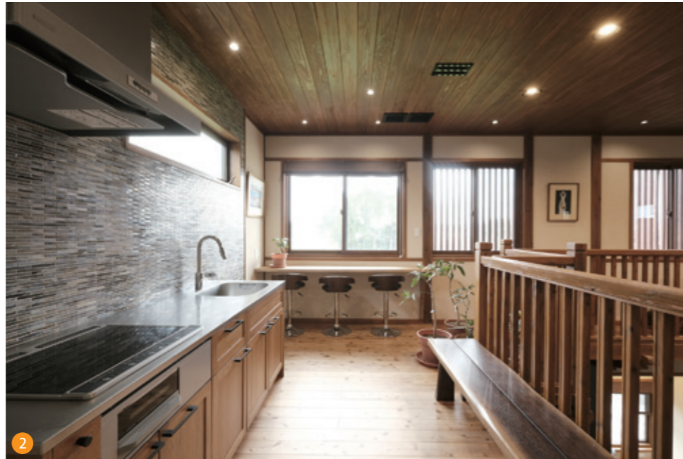
2 自然豊かな景色を眺めながらティータイムを過ごせる2階キッチンとカウンター。夏は地域の花火大会も見ることができます