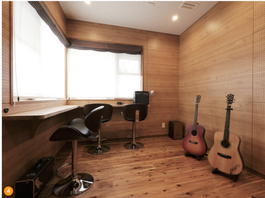
4 ご家族の趣味の音楽室。防音仕様になっているので、気兼ねなく演奏ができます