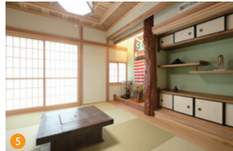
5 随所に大工技術を駆使した和室。高い技術が必要とする伝統的な和室にも対応できるのが弊社の強みです