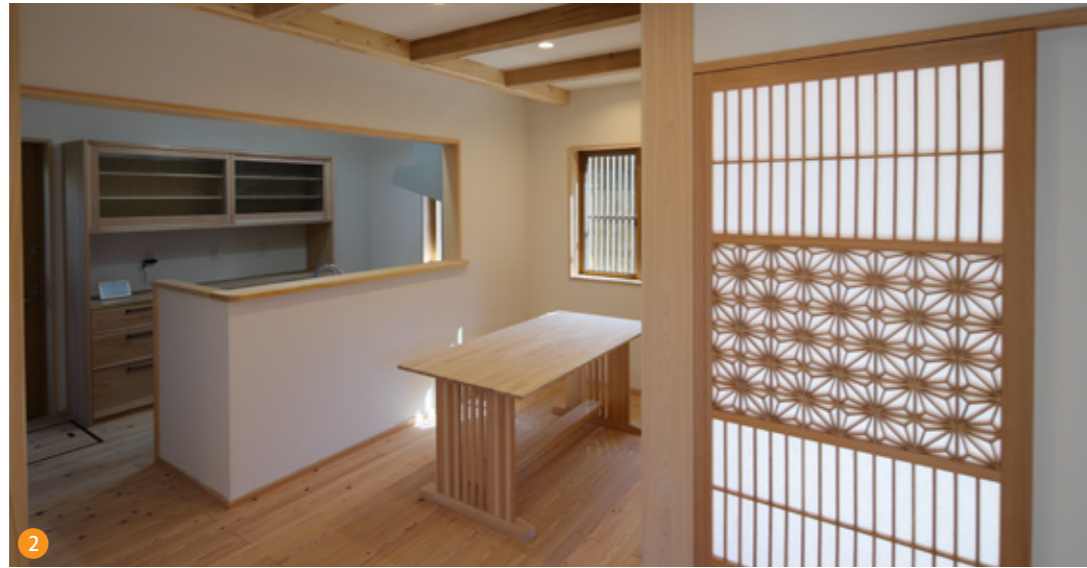
リビング入口の引き戸は麻の葉をモチーフにした組子細工がアクセント