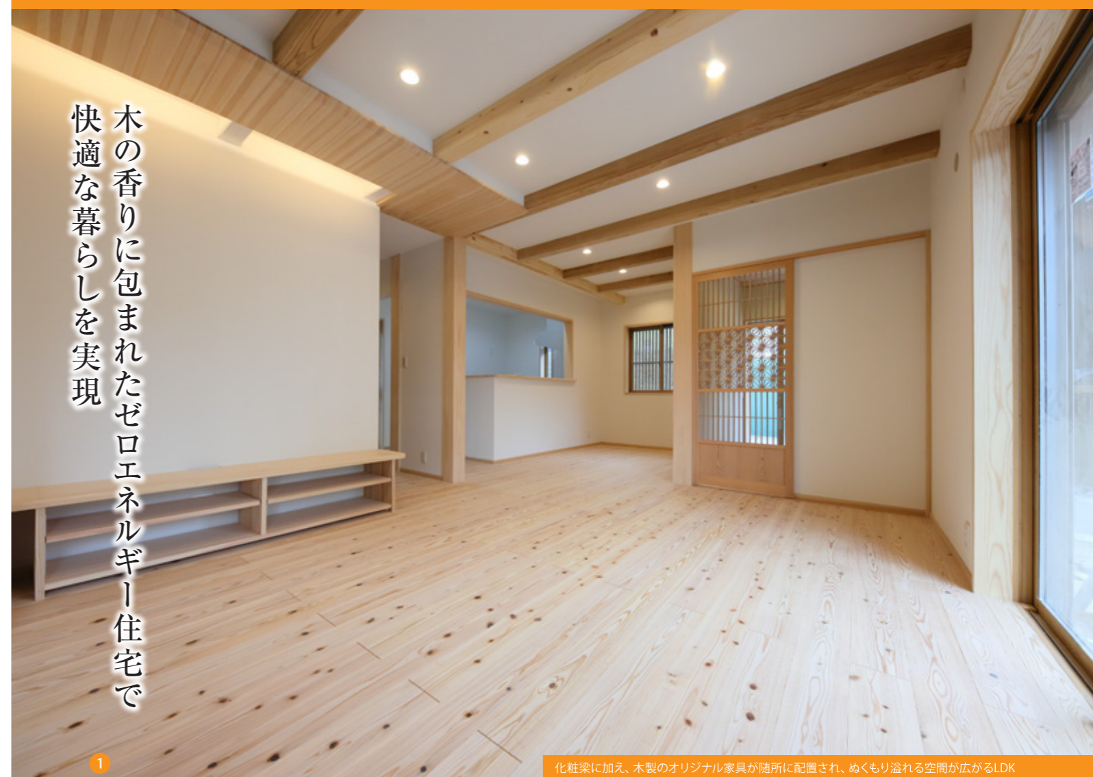
化粧梁に加え、木製のオリジナル家具が随所に配置され、ぬくもり溢れる空間が広がるLDK