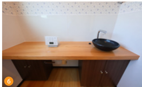
トイレは広々とした空間を確保しました。収納家具付き手洗い場はオーダーメイド、県産杉のカウンターは弊社製品