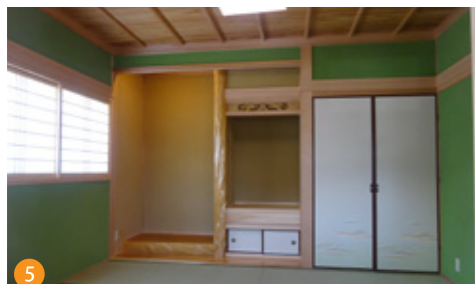
伝統的な真壁造りとし、柱と天井は杉、床の間の化粧材はイヌマキを使用。木材を引き立てる壁は、珪藻土で仕上げました