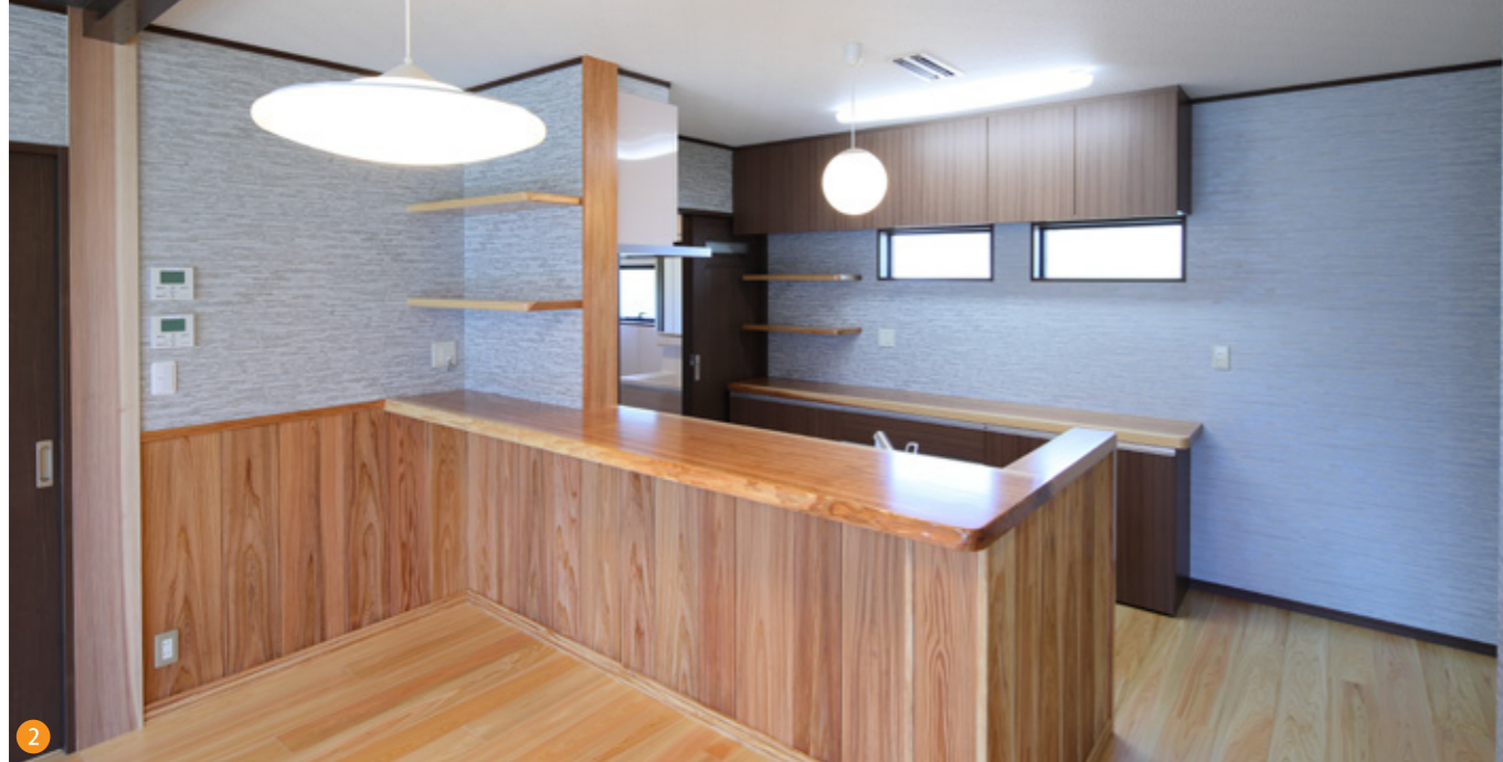
かごしま材がふんだんに使われた対面キッチン。幅60cmのキッチンカウンターはシンプルな空間を華やかに演出します