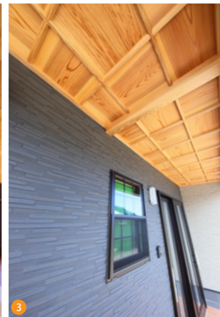
玄関前のポーチ天井は県産天然杉の格子天井にし、木のあたたかみを感じる職人技が光る場所になりました