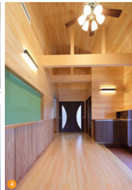
上り框から化粧梁、壁・床まで全て無節の杉と檜で仕上げました。開けた瞬間、明るく開放的なホールが目の前に広がります