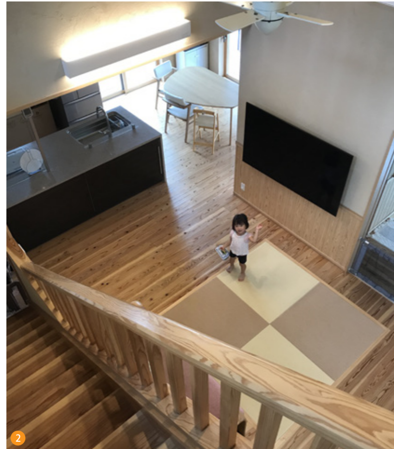
2 ゆったりと開放的な吹抜けリビング。吹抜けを介して1階と会話もできます