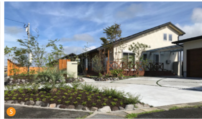
5 木製フェンスと緑の植栽が広めのウッドデッキと白の外観を際立たせています