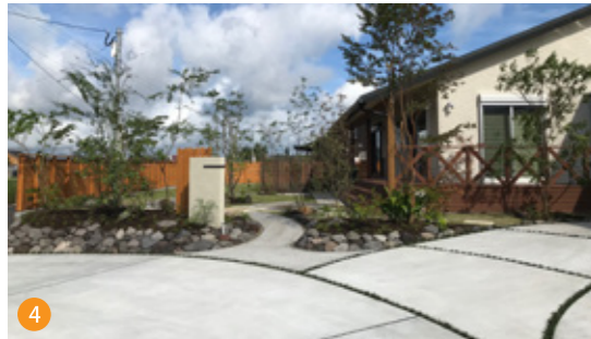
4 山に自生する自然木や桜島の溶岩と芝生の融合が、スタイリッシュな雰囲気の中にも自然のやすらぎを感じさせる庭になっています