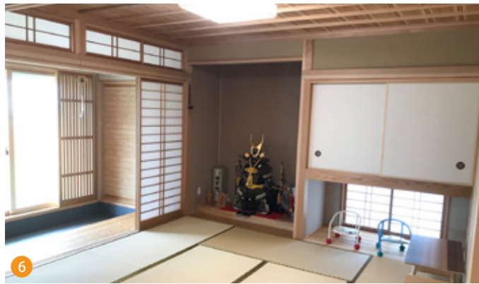
6 純和風の和室には縁側の代わりに土間を設置して、料亭の和室のような雰囲気を醸し出しています