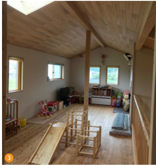
3 2階の子ども部屋は屋根裏部屋のようなワクワクする空間で、まるで保育園の一部のようです