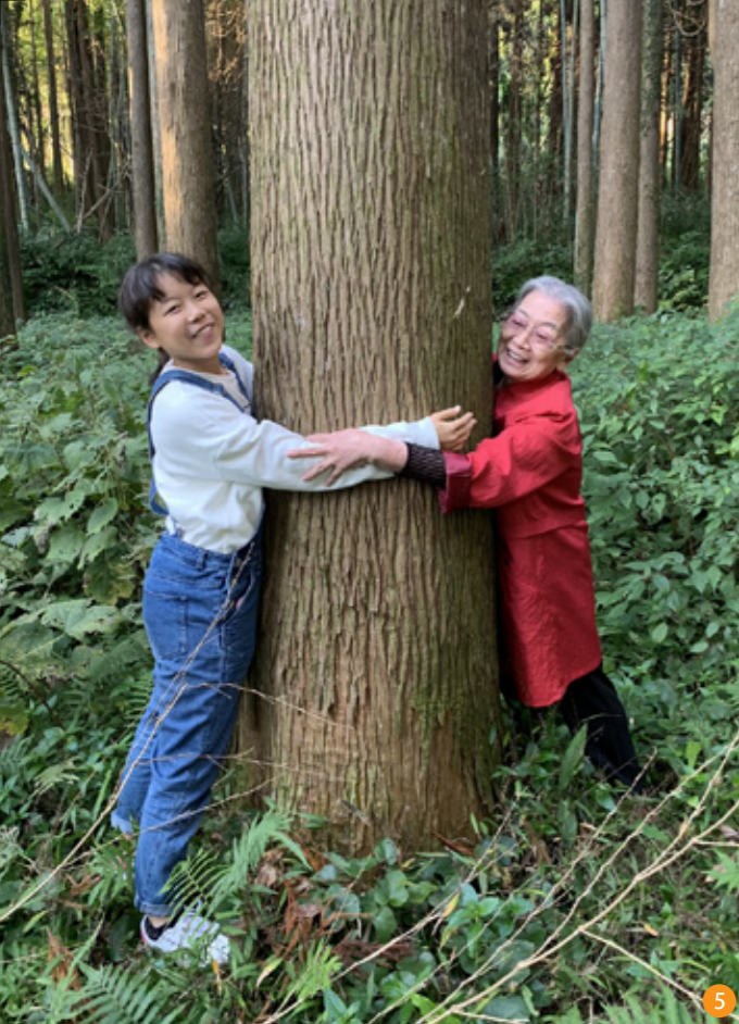
5 知覧の山林へ視察に行った際の仲良しご家族。代々受け継がれ、手入れが行き届いた立派な杉の木が家づくりに活きました