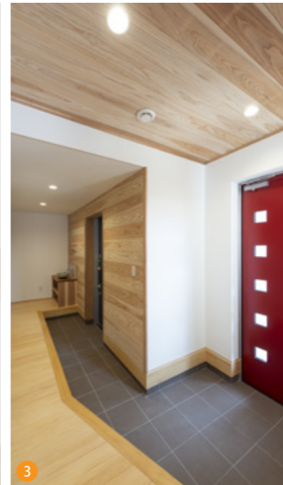
3 正面玄関とガレージから玄関ホールへのつながり。帰宅したらまず手洗い、その後そのまま収納部屋で荷物を整理できます