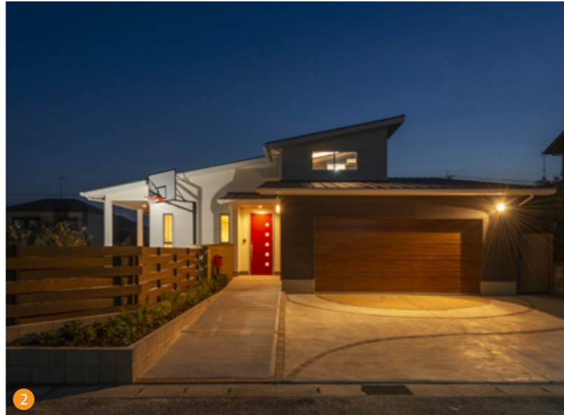
2 ビルドインガレージとバスケットゴールが印象的な外観。バスケットボールを描いた駐車スペースも建物と調和しています