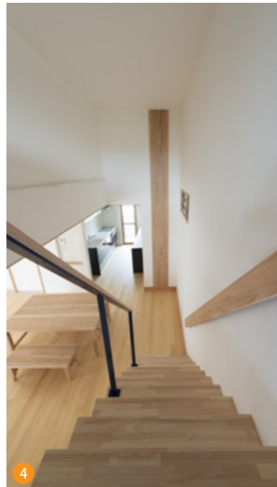
4 知覧の木が感じられる杉の板がオブジェとして取り付けられ、ご先祖からの家族のつながりを毎日感じることが出来ます