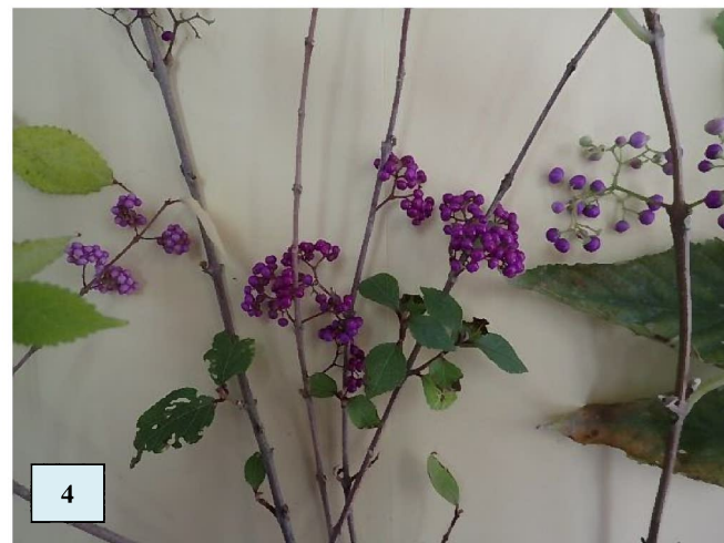
図 1. 花. 左からトサムラサキ, 雑種, オオムラサキシキブ. 花裂片が反って桃色を帯びるのはオオムラサキシキブに近い. 2015 年 7 月 19 日.