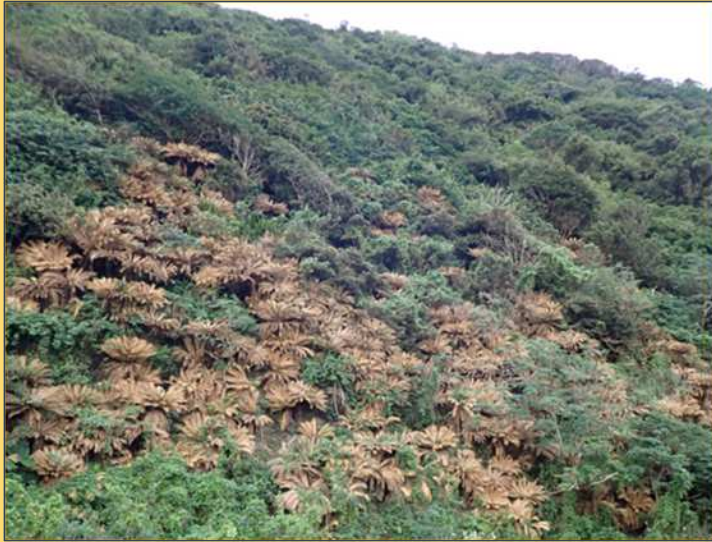
奄美市名瀬で発生した集団枯損

○ 大島地区において、外来種のソテツシロカイガラムシ アウラカスピス ヤスマツイ (学名：Aulacaspis yasumatsui) によるソテツの枯損被害が発生しています。