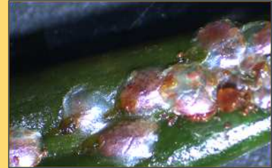
葉に付着する Aulacaspis yasumatsui