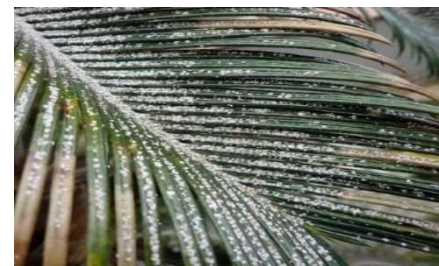
葉に付着する Aulacaspis yasumatsui