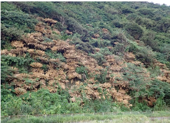
奄美市名瀬地区で発生した集団枯損