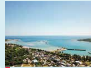
10 天城岳の麓、山(サン)集落

ウミガメが上陸し、闘牛が散歩する砂浜、集落に残る神道など伊仙の暮らしを感じられる