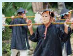
8 国指定重要無形民俗文化財「諸鈍シマヤ」

歩くだけで海を存分に体感できるコース。異なる3つの浜(蘇刈、嘉鉄、清水)を裸足で歩いて感じよう