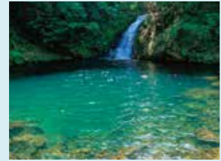
4 奄美フォレストポリス・マテリアの滝