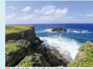
13 断崖絶壁、迫力満点の半島