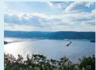
3 名瀬の町と港の眺望

世界自然遺産を有する奄美群島の島々を満喫する旅 ～そこにしかない自然、文化、そして人との出会い～