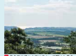
11 美名田林道から海に向かって開けた景色