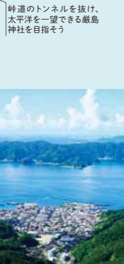
7 高知山展望台からの大島海峡と古仁屋市街地の眺め

奄美クレーターとも呼ばれる赤尾木湾。二つの海を見渡せる絶景トレッキングを楽しもう