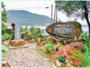
2 歴史とロマン、西郷翁上陸の地