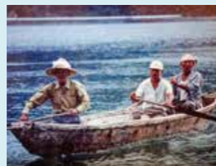
5 芦梭待ち網漁(体験漁もできる)