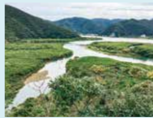
6 命育む住用マングローブ林