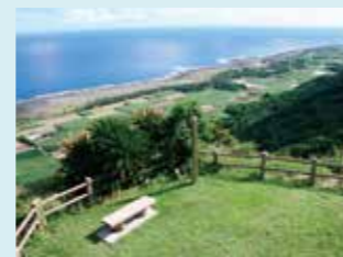
9 百之台からの眺望