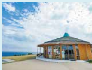
1 カフェスペースもあるあやまる岬