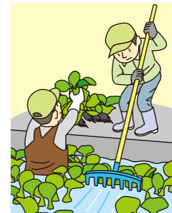
人力での引き上げ

越冬株の抜き取りによる防除を行います。防除直後の茎には再生能力があるため、飛散しないように厚手のビニール袋に詰める。また、水を含むと非常に重く、重機等を必要とする場合があります。