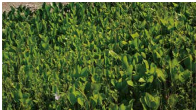
密集して生育するホテイアオイ→

在来植物との競合や水面下を被陰することによる生態系への影響があります。また、通水障害や船の通行を妨害したりします。