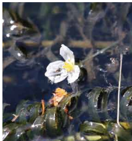
オオカナダモの花