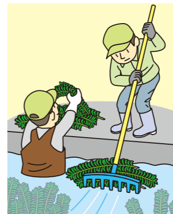
人力での引き上げ