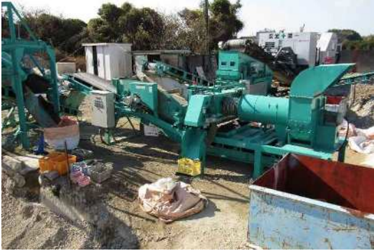
破碎選別ユニット全景