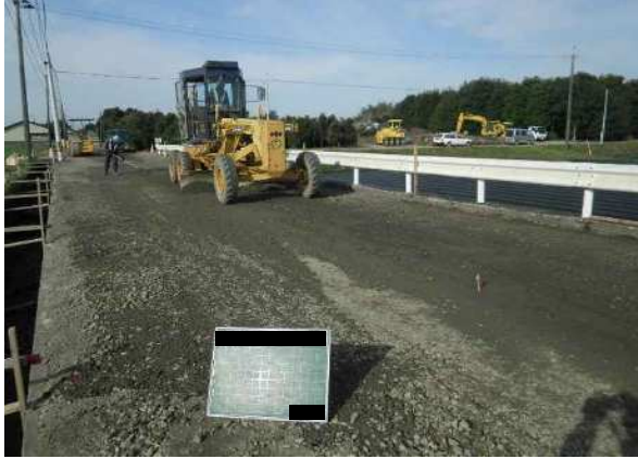
下層路盤材 敷均し状況 ・モーターグレーダ