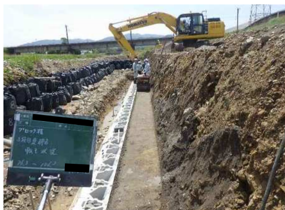
ブロック積 裏込砕石 転圧状況 ・振動ローラ