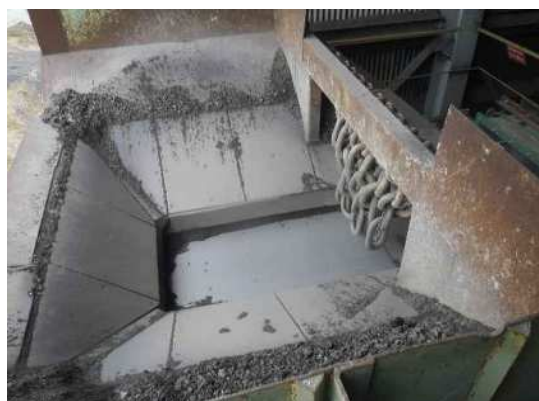
2次破碎 インパクトクラッシャ 投入口