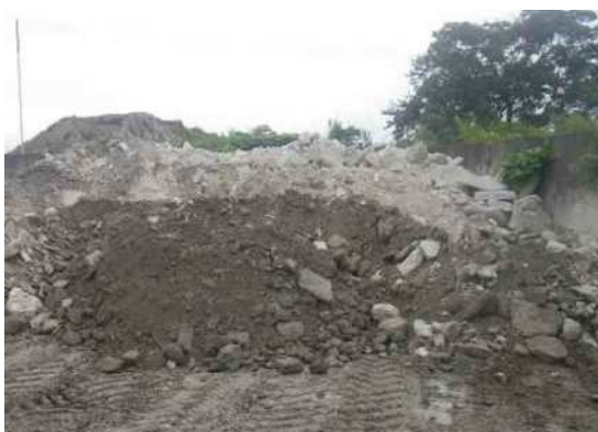
コンクリート塊 ストック状況