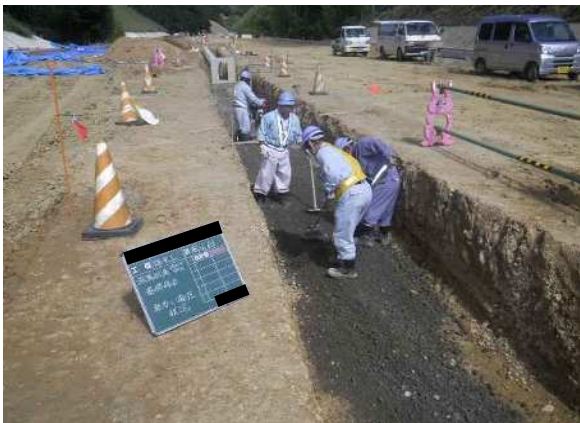
排水溝 基礎砕石 敷均し状況 ・人力敷均し