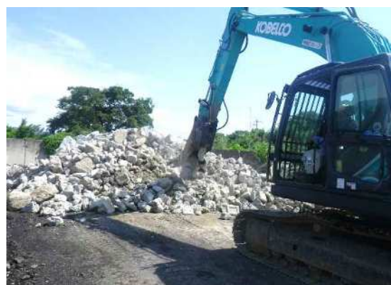
1次破碎 (小割) ・異物の除去