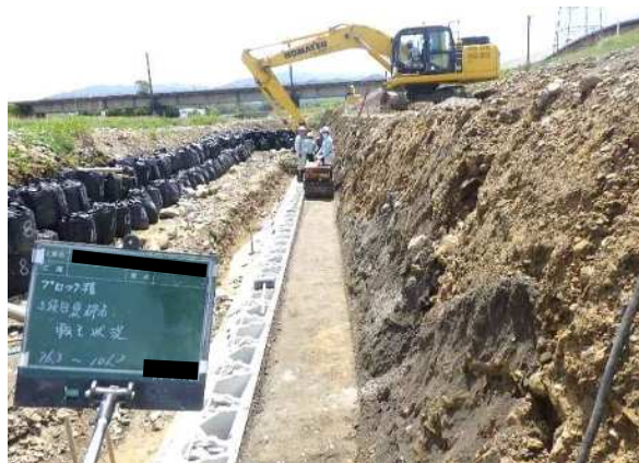
ブロック積 裏込砕石 転圧状況 ・振動ローラ