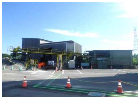
製造施設 ・破碎機,振動篩機は建屋内に設置