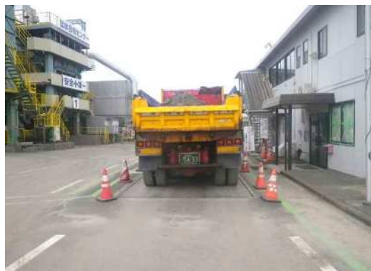
コンクリート塊 処分受入