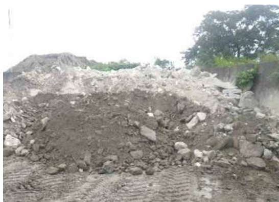
コンクリート塊 ストック状況