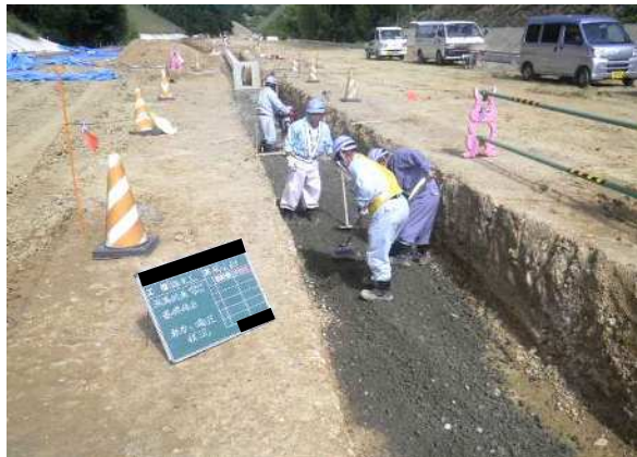
排水溝 基礎砕石 敷均し状況 ・人力敷均し