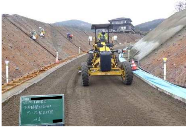
下層路盤材 敷均し状況 ・モーターグレーダ