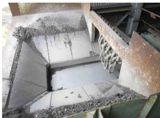
2次破碎 インパクトクラッシャ 投入口