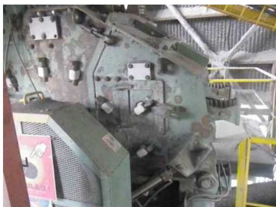
2次破碎 インパクトクラッシャ にて材料を破碎 ・中山鉄工所 NCDH1B