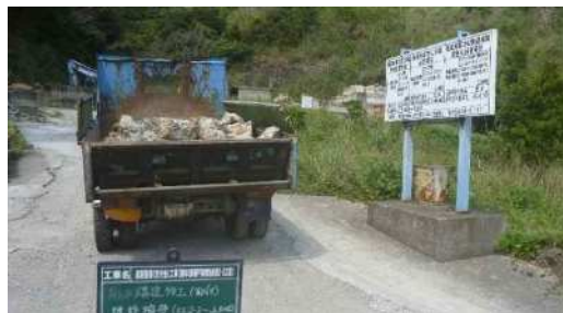
原材料(コンクリート塊、アスファルト塊)の搬入