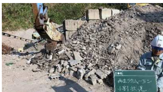
磁選機付小割機 ・大きい廃材の小割 ・磁選機で鉄筋等の異物除去 ・Co殻、As殻は別々に小割