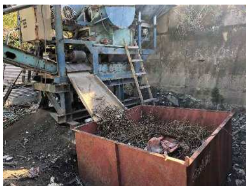
・破砕後、磁選機で異物除去