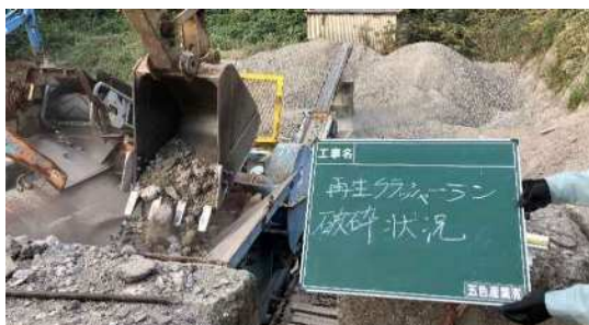
・パワーショベルのバケットで CoとAsを1対1で混合して投入