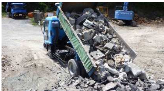
原材料保管場所へ荷下ろし CoとAsは別々に保管