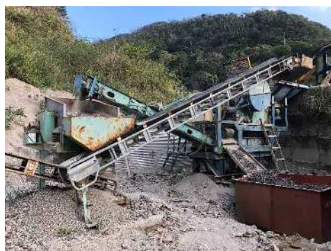
破砕ユニット ・(株)中山鉄工所 HFA4M型 にて破砕処理