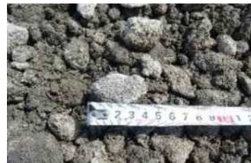
再生クラッシュランRC-40