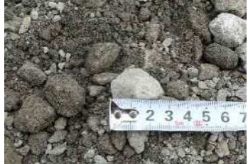
再生クラッシュランRC-30