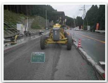
使用状況(道路用路盤材)