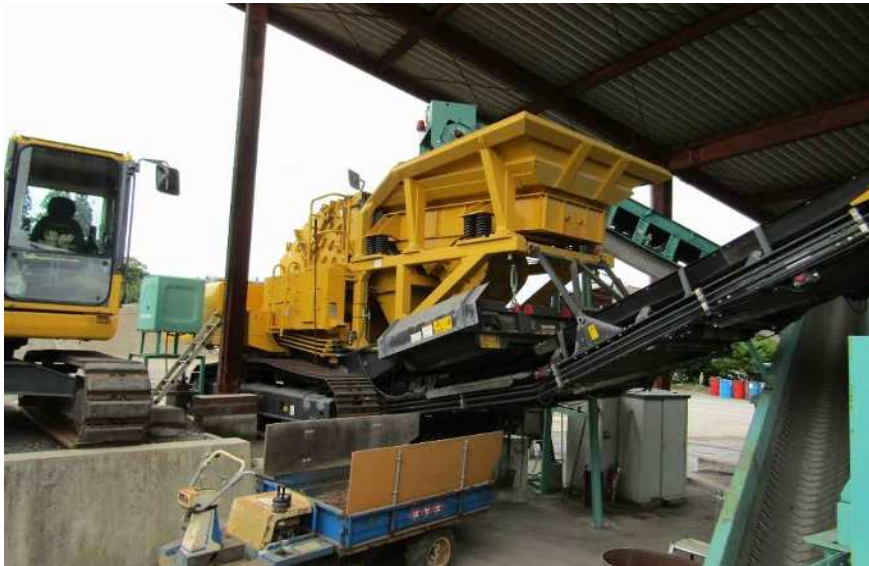
破砕機で破砕 破砕後、磁選機で金属を除去 ・コマツBR250G