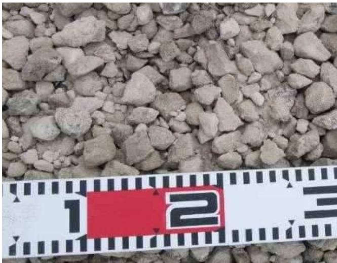
製品 再生碎石 (RC-30)