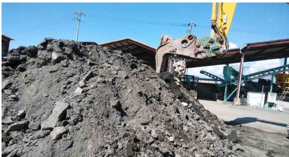
小割・磁選機で異物除去 (アスファルト塊)