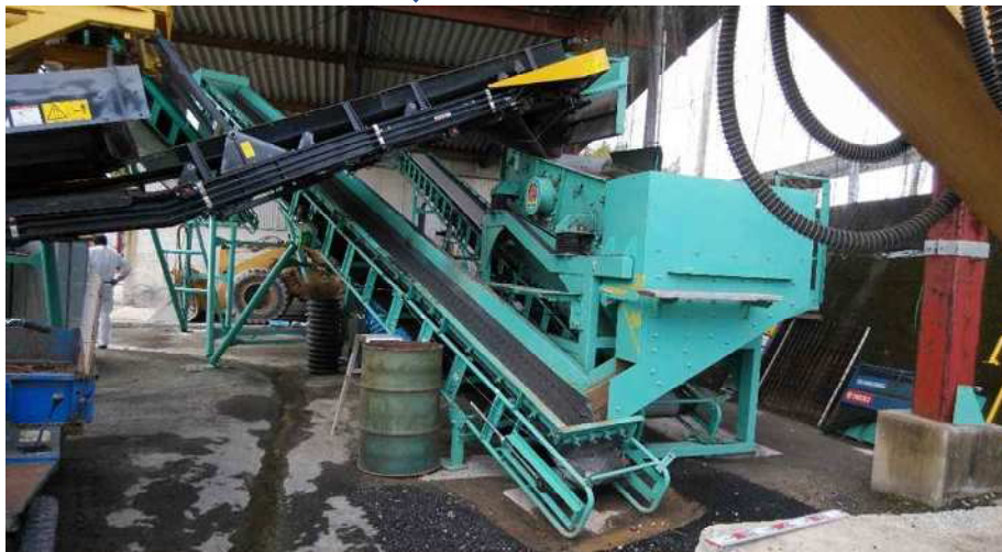
スクリーンで選別 ・中山鉄工所NH S482 ・40mm、30mmの2段 (製品サイズはレバーで切替) ・30mmオーバーサイズは 破砕機へベルトコンベアで リターン