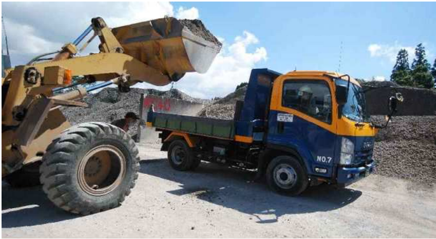
出荷のためダンプへ積み込み