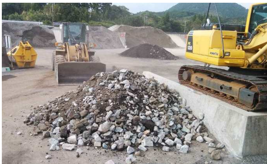
ホイールローダーで、コンクリートとアスファルトを1対1で混合