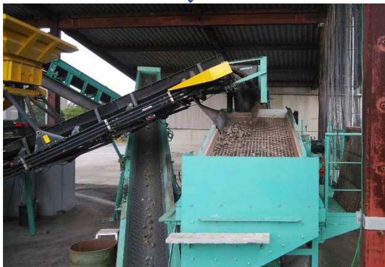
下段の30mmスクリーン