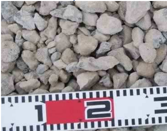
製品 再生砕石 (RC-40)