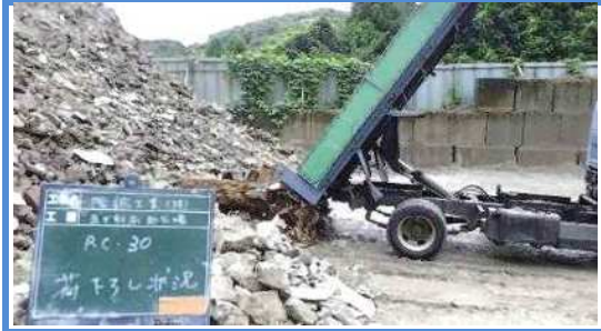
原材料保管場所へ荷下ろし