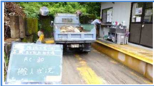
原材料(コンクリート塊)の搬入