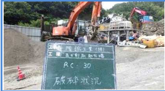
振動篩機 ・篩機により30mm以下と30mm以上に選別する。 ・30mm以上は再度破碎機にリターンする。