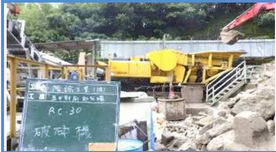
インパクトクラッシャー ・(株)小松製作所 BR350JG-1型にて破碎処理 ・破碎後、磁選機にて異物除去