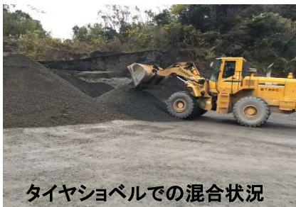
タイヤショベルでの混合状況