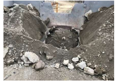
②一次破碎機 ジョークラッシャ