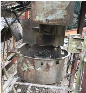
⑪二次破碎機アストロコン