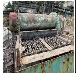
振動ふるい機 40mmスクリーンで選