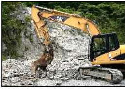
鉄筋等の異物除去