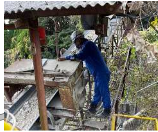
金属探知 人手による異物除去