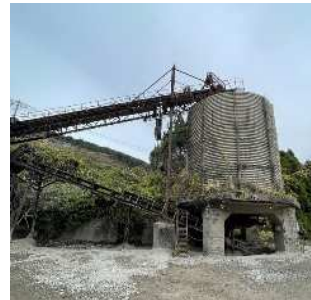
1次破砕石のストック