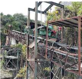
鉄筋等の異物除去