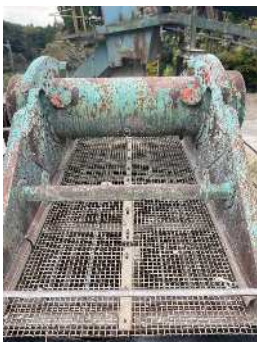
振動ふるい機 30mmスクリーンで選