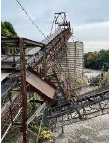
鉄筋等の異物除去