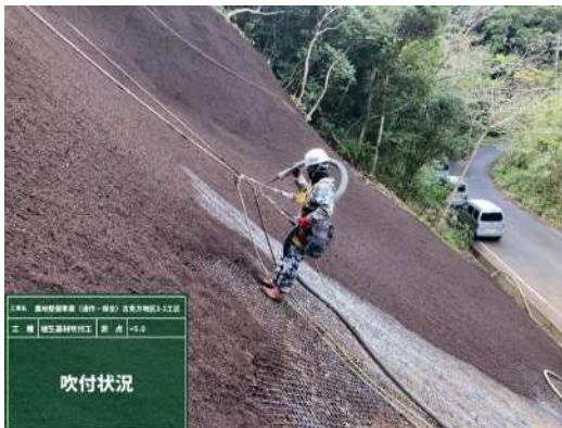
法面吹付の作業状況