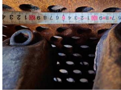
破砕機のφ30mmスクリーン