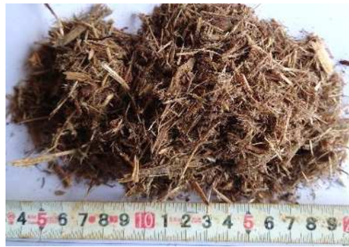
製品【奄美エコソイル】

吹付用ホースの目詰まり防止のため、 必要に応じて、アジテートフィーダー（攪拌定量 供給装置）とロータリースクリーンで解す