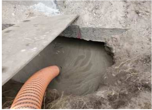
建設汚泥流動化処理土の 打設作業